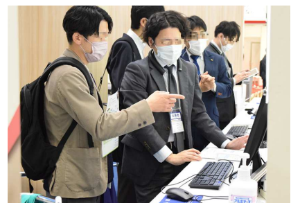
※当社主催の展示会の様子

店舗のEC化が急速に進む現在、店舗DX内の特設ゾーンである「ECゾーン」には、リアル店舗とECとの連携を促進するツールや、オンライン接客システム、在庫管理・分析システムなどが出展するほか、ECサイト構築支援から運用・売上増の支援サービスまで多数展示される。販売チャネルを増やし、売上を伸ばしていきたい店舗運営者にとって必見のゾーンだ。