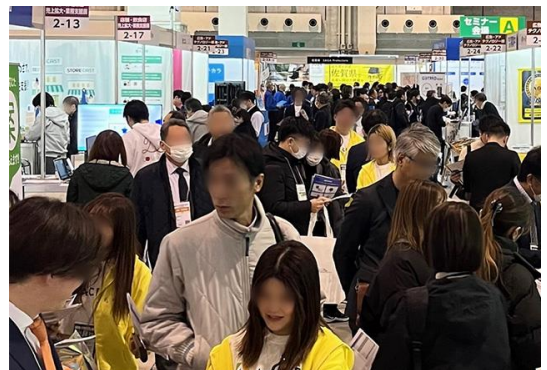
※昨年開催されたDXPO大阪'24の様子

前半2日間はバックオフィスDXPO、後半2日間は営業・マーケ/IT・情シス/店舗・EC DXPOを開催！